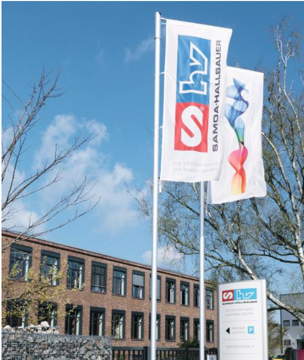
Der Hauptsitz der SAMOA-HALLBAUER GmbH in Viernheim.